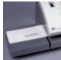
Käyttäjystävällinen "punnitse ja työnnä" -leimaus

➔ Lisäksi voit näppäillä jopa viisi omaa tekstisanomaa suoraan IJ35:n näppäimistöä ja tulostaa ne maksuleiman viereen. Tämä on käytännöllinen ominaisuus kausittaisia viestejä varten, esim. joulutervehdys voidaan tallentaa muistiin helposti kutsuttavaksi.