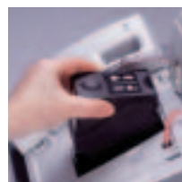
Nopea, siisti väripatruunan vaihto