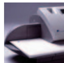
Lähetysten paksuus jopa 10 mm