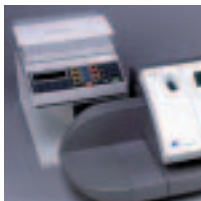
Lisävarusteena 3 kg:n tai 5 kg:n vaakaliittämä

➔ Yksilöllisiä mainosleimoja voidaan ladata ja tallentaa digitaalisilta muistikorteilta - laitteen muistiin mahtuu 7 suoraan valittavissa olevaa leimaa. Digitaalinen ohjaus mahdollistaa mutkikkaiden logojen, grafiikan ja jopa valokuvien tulostamisen järjestelmästä.