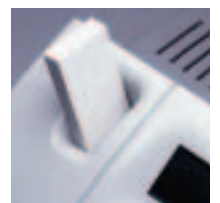
Automaattinen tarrojen syöttölaite