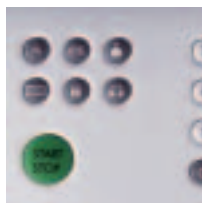
Yhden kosketuksen pika- valintapainikkeet